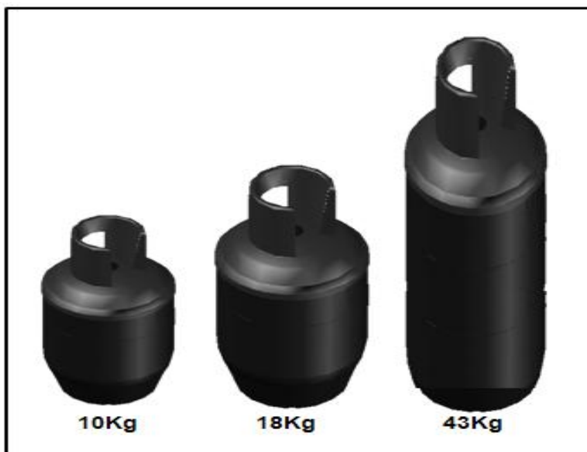
Figura 8.2.- Cilindro Metálico Tradicional 10, 18 y 43 kg